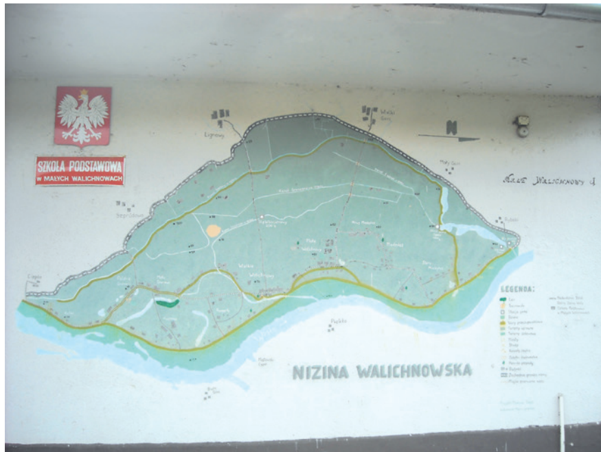
Fragment wału na Nizinie Walichnowskiej

wie wału znalazło pracę wielu robotników z Pomorza i z głębi dzisiejszej Polski. Mieszkali oni w budynkach zbudowanych dla nich na Kuchni.