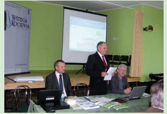
Obrady Zgromadzenia Partnerów LGD Wstęga Kociewia w Dzierżążnie-21.05.2010

wszystkich 5 gminach widzę ludzi równie oddanych sprawie, czujących potrzebę bezinteresownej pracy dla innych, to właśnie myśl o nich zdecydowała o przyjęciu propozycji bycia liderem w Leaderze. Dodatkowym argumentem było to, że w owym czasie we władzach „Wstęgi” zarysowała się polaryzacja poglądów i dyskutanci doszli do wniosku, iż moja osoba jest do zaakceptowania dla obu stron sporu. Miano też nadzieję, że sprawy LGD ruszą do przodu. Dziś cieszę się, że poprzez dobre wykorzystanie funduszy unijnych może wspierać ludzi aktywnych, ich dobre