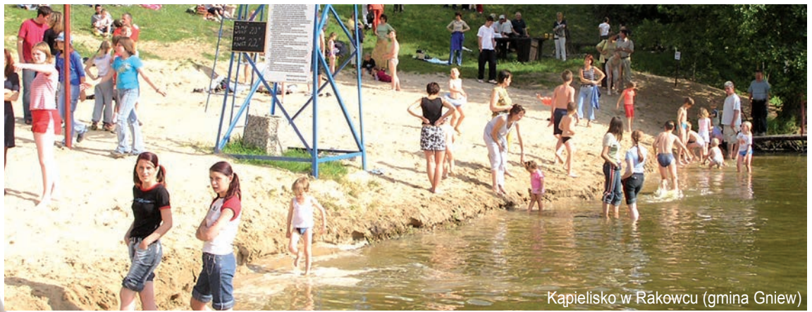
Kapielewisko w Rakowcu (gmina Gniew)

W zeszłym roku płynąłem Wierzycą i jest to niewątpliwie ciekawe doświadczenie wraz z dużą dawką adrenaliny. Wierzyca jest trudną rzeką, trzeba liczyć się z wywrotkami oraz z licznymi przeszkodami czy to naturalnymi, czy spowodowanymi działalnością człowieka. Dużą część życia spędziłem na wodzie m.in. uprawiałem wioślarstwo. Pływając trzeba potrafić czytać wodę, zachowanie nurtu. Myślę, że gdyby były finanse na udrożnienie niektórych szlaków kociewska turystyka wodna mogłaby stać się jedną z lepszych na Pomorzu.