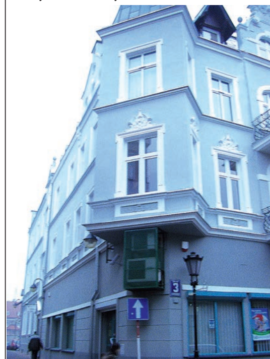
Budynek, w którym mieści się Biuro LGD