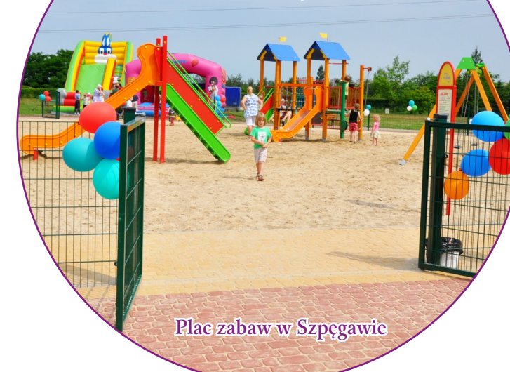
Plac zabaw w Szpęgawie